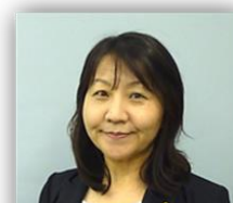
社労士事務所HANA代表