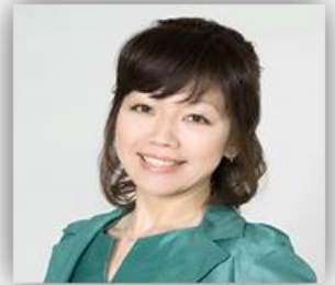
トータルマネージメントオフィス代表