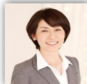
たぐち社会保険労務士代表