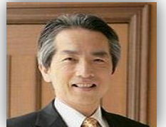
前畑社会保険労務士事務所代表